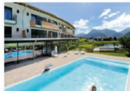
HOLZLEITEN Bio Wellness Hotel****