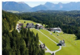
Hotel & Wellness- Refugium »Das Kranzbach«